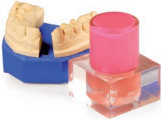
Duplicación elástica Elite Double 8 o 16 Shore A