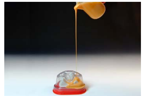
6. Verter Elite Double en la mufla