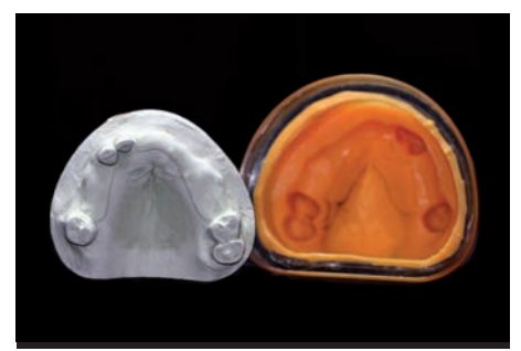
8. Duplicación final