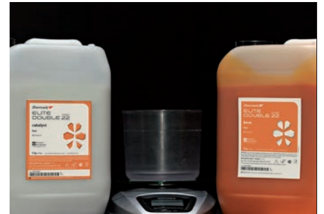
3. Dosificar la base y el catalizador Elite Double (relación 1:1)