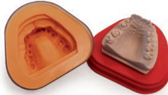
Duplicación estándar Elite Double 16 o 22 Shore A