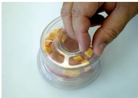
5. Elite Double reciclado puede emplearse para llenar la mufla