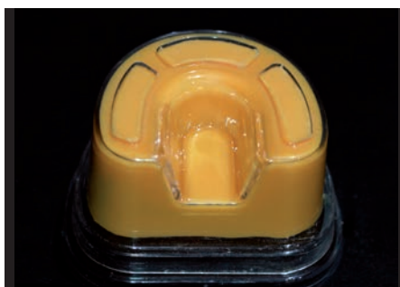
7. Esperar hasta que polimerice