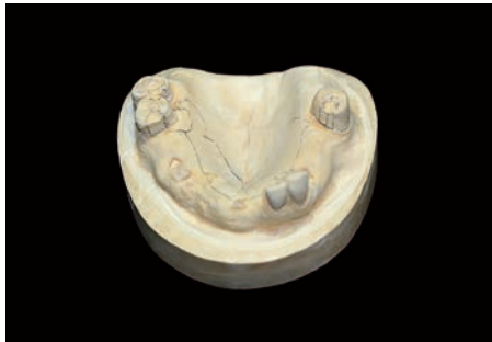
1. Duplicación de modelo