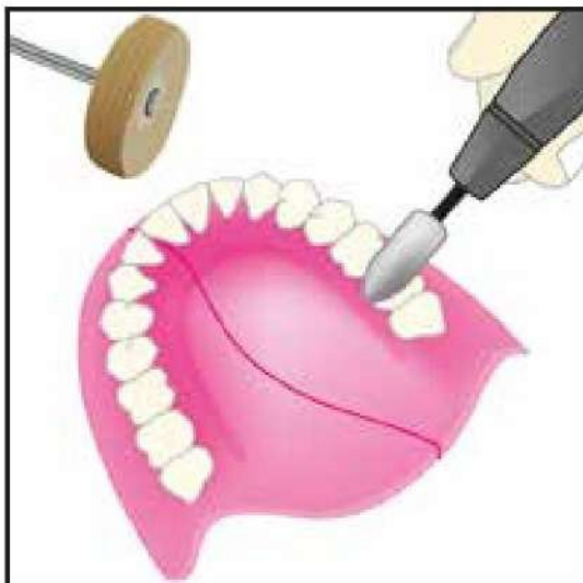
7- Pula la superficie de la reparación

Medical device for dental treatment, reserved for healthcare professionals. Please read the instructions on the leaflet or on the label carefully before use. Class : IIA (CE marking certified by SGS) CE0120.