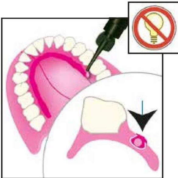
5- Cubra la trenza y el canal con el composite Fiberforce Flow